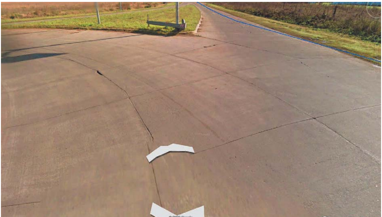
Imagen 4. Deterioro en la Intersección de la R.P. N° 227 y R.P. N°55. Partido de Loberia

El presente pliego contempla la ejecución de reconstrucción de losas en la totalidad de Zona Vial XII, manteniendo las características geométricas de las mismas.