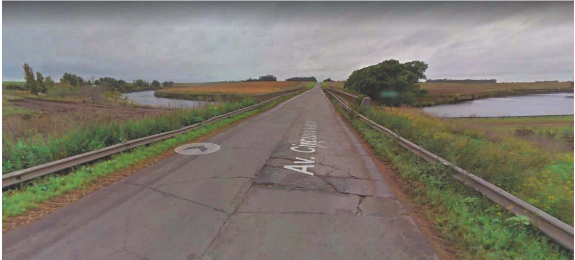
Imagen 3. Deterioro en losas en Partido de Necochea