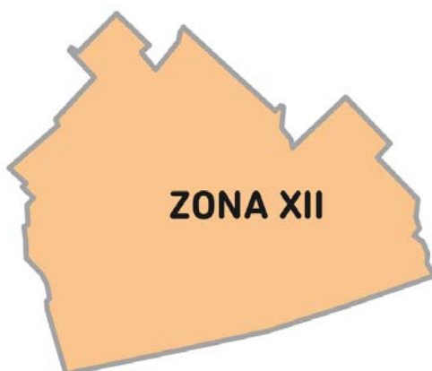
Imagen 2. La Zona XII está conformada por los Partidos: Adolfo Gonzáles Chávez, Benito Juárez, Lobería, Necochea, San Cayetano Y Tres Arroyos.