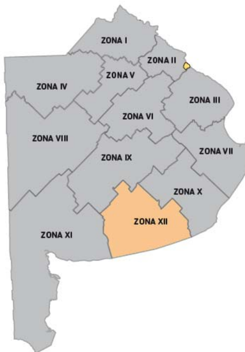
Imagen 1. División de Zonas Viales de la Provincia de Buenos Aires

En las siguientes imágenes se muestra la Zona XII sobre la Provincia de Buenos Aires, la cual será el área a intervenir: